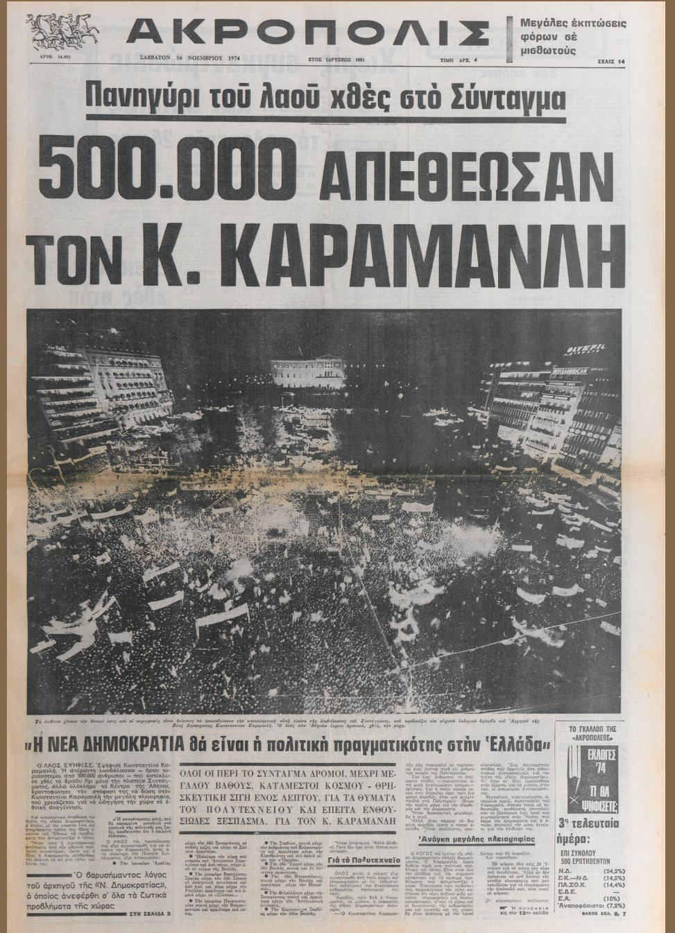
«500.000 απέθεωσαν τον Κ. Καραμανλή», εφ. Ακρόπολις, 15 Νοεμβρίου 1974