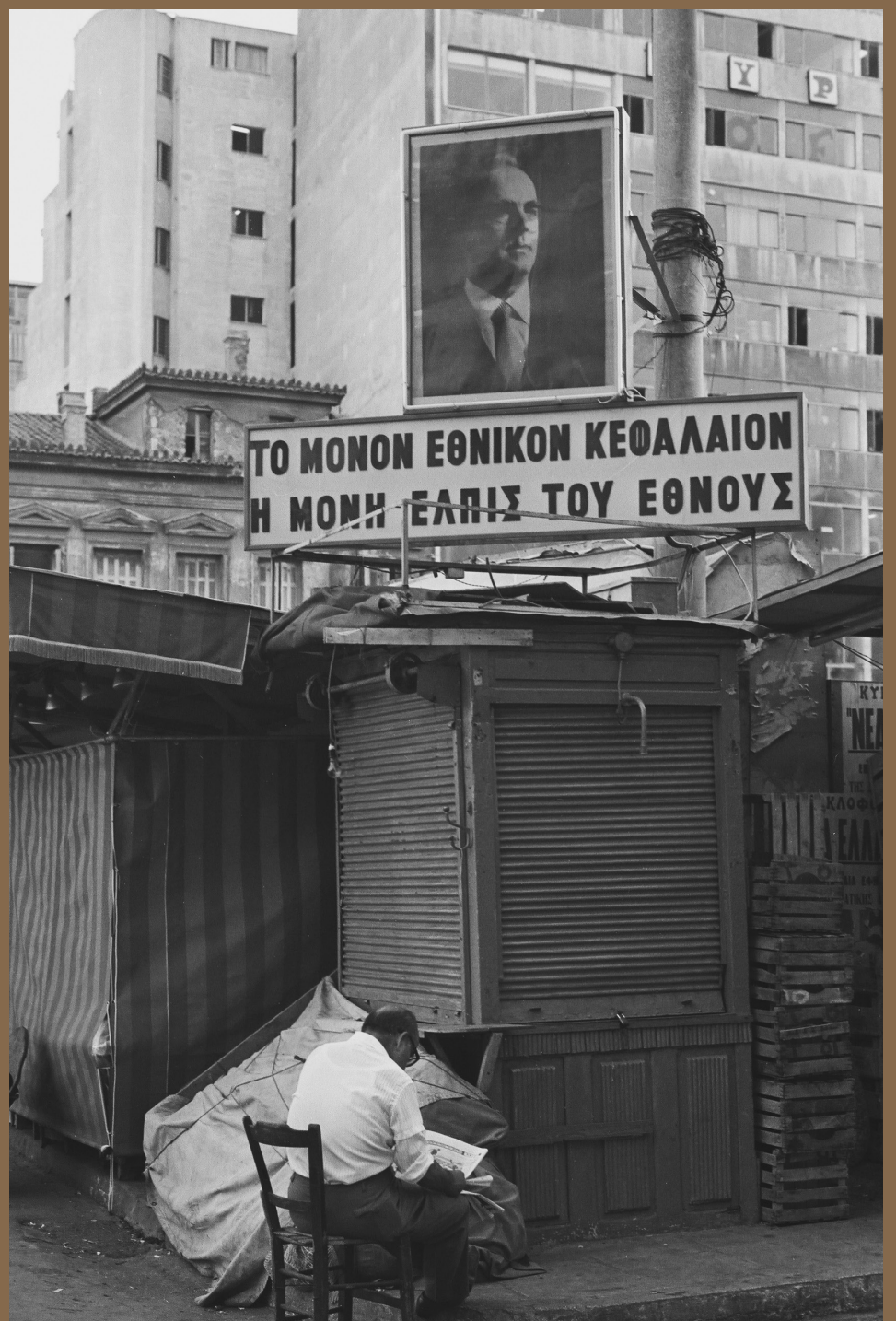
Στιγμιότυπο από την προεκλογική περίοδο