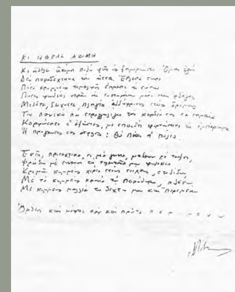
Χειρόγραφο του ποιητή Αρχείο του ποιητή