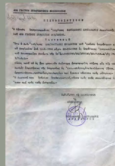
Πιστοποιητικό υπηρεσίας στο 406 Γενικό Στρατιωτικό Νοσοκομείο Ιωαννίνων, όπου υπηρετεί ως ακτινολόγος, Αύγουστος 1954-Οκτώβριος 1955 Αρχείο του ποιητή