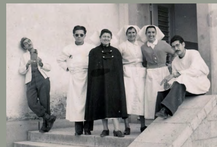
Φωτογραφίες από τη θητεία του ως στρατιωτικού ιατρού στο 406 Γενικό Στρατιωτικό Νοσοκομείο Ιωαννίνων