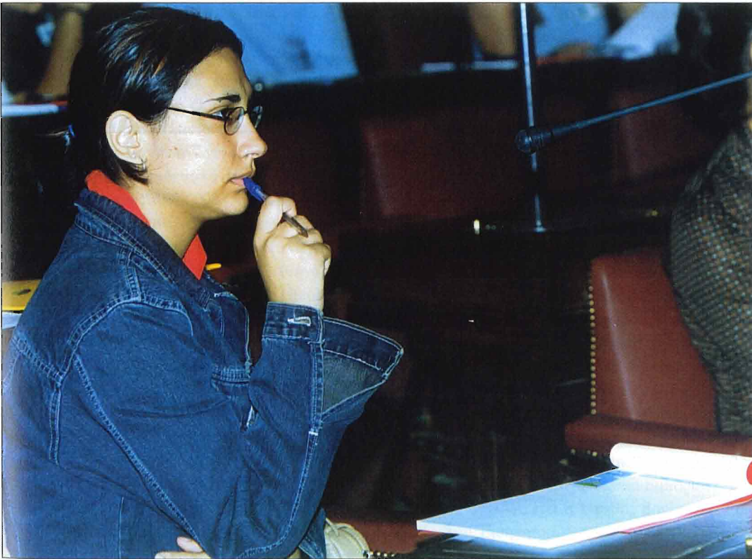
Στιγμιότυπα από συνεδριάσεις Επιτροπών της «Βουλής των Εφήβων».