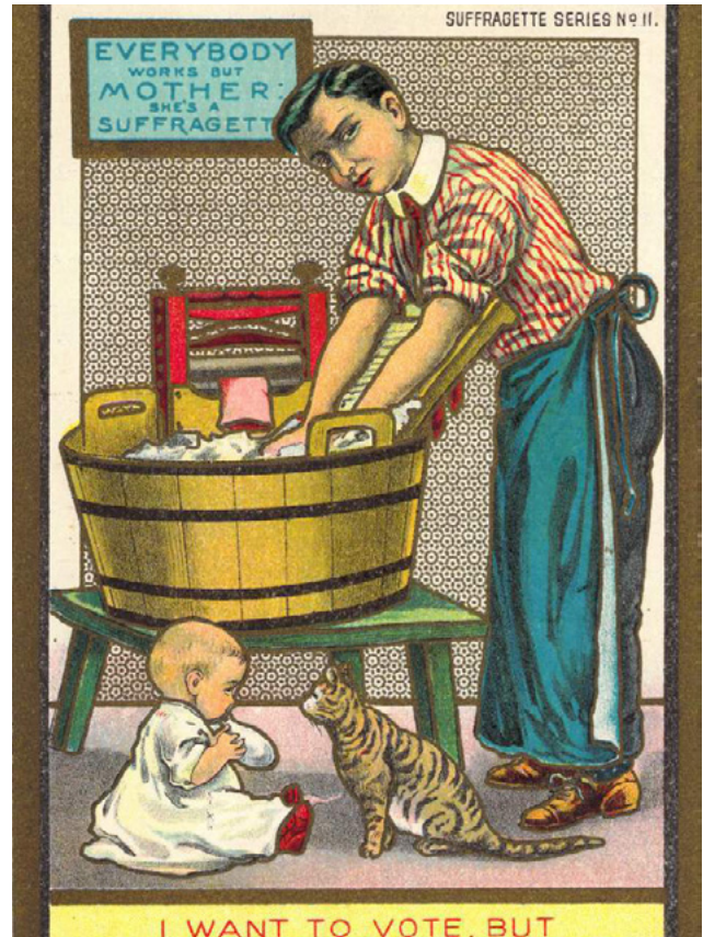
Αφίσα 4η | Κείμενο της αφίσας: ΘΕΛΩ ΝΑ ΨΗΦΙΣΩ ΑΛΛΑ Η ΣΥΖΥΓΟΣ ΜΟΥ ΔΕΝ ΜΕ ΑΦΗΝΕΙ