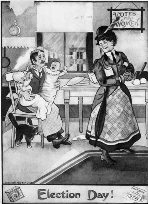
Αφίσα 2η | Ημέρα εκλογών